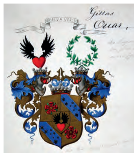
Vapenskiss för friherrliga ätten nr 406 Dickson.