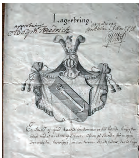
Vapenskiss för adliga ätten nr 2061 Lagerbring.