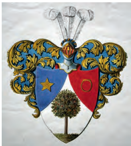
Utkast adliga ätten nr 2302 Skogman.