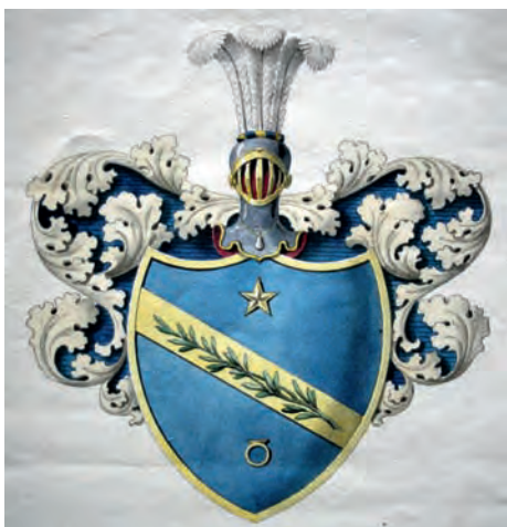
Utkast adliga ätten nr 2302 Skogman.