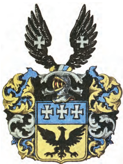
Adliga ätten Adlercreutz nr 1386.

Några andra adliga ätter som Mörner och Pauli har blivit förlånade en vanlig adlig rangkrona men de allra flesta har ingen alls utan hjälmen kröns endast med en hjälmbindel.