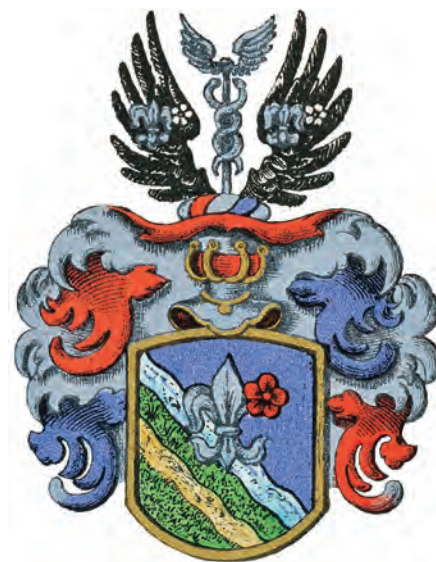
Adliga ätten Rosenmüller nr 706.