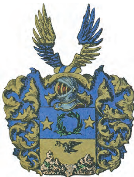
Adliga ätten Lagercrantz nr 1011.