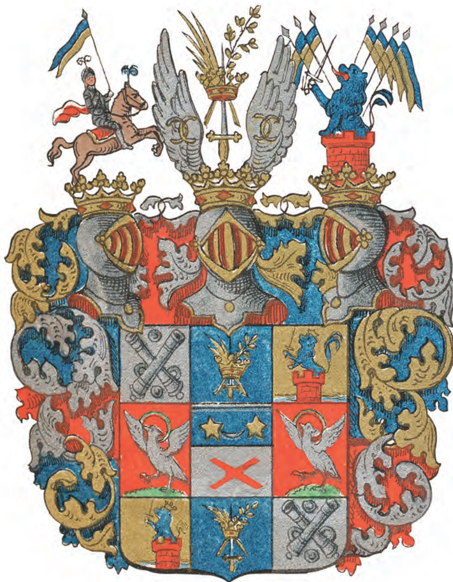
Grevliga ätten De la Gardie nr 3.

för illustrationen i vissa fall kan förefalla »smetig». Mycket har dock rättats till i Photoshop.