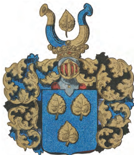
Adliga ätten Ribbing nr 15.