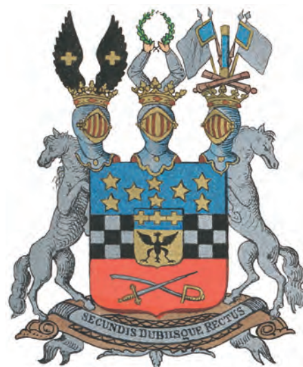
Grevliga ätten Adlercreutz nr 125.