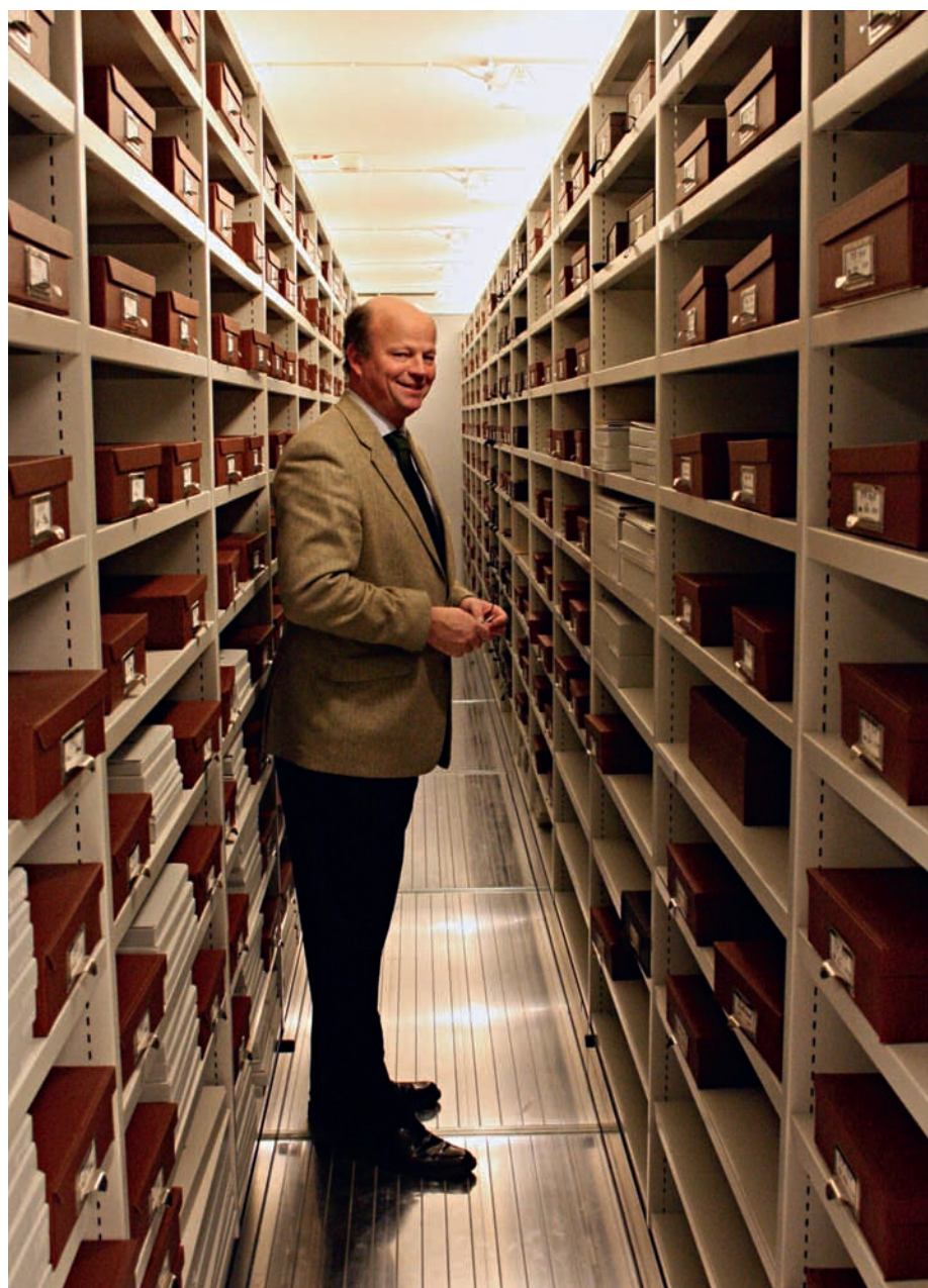
Handskriftsavdelningen i Riksarkivets atom-bombsäkra valv under Marieberg i Stockholm.

– Inom heraldiken talar man om häroldsbilder, med nonfigurativa enkla geometriska mönster, och allmänna bilder, med figurati-