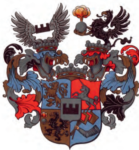
Wrangel af Lindebergska vapnet i färgtryck i Adelskalendern 1903 enligt vapenbeskrivningen i friherrebrevet 1654.

Förhistorien till brevet från 1654 är både intressant och något komplicerad. Redan 1651 hade nämligen ovanstående Herman Wrangels äldste son Carl Gustaf (1613–1676) blivit upphöjd till greve Wrangel af Salmis och introducerats 1653 under nr 13, men slöt själv ätten på svärdssidan. Den 6 april 1653 erhöll han ytterligare Lindeberg i Halland som friherreskap och förbättrat vapen. Samma år upphöjdes Herman Wrangels barn, dock begränsat till barnen i tredje giften med grevinnan Amalia Magdalena av Nassau (tyska furstehuset), i friherrlig värdighet den 8 oktober 1653 på Stockholms slott av drottning Kristina. Detta brev ersattes sålunda av det ovan beskrivna brevet från 1654.