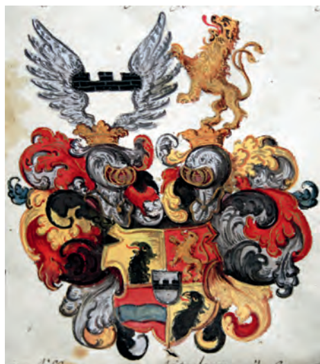
Wrangel af Lindebergska vapnet i friherrebrevet från 1653.

Wrangels (1584–1643) tre giften för faderns förtjänster i friherrlig värdighet den 21 mars 1654 på Uppsala slott av drottning Kristina med nytt vapen och de skulle skriva sig Lindeberg. Ätten introducerades den 7 juni 1654 under nr 41. Det är två intressanta avvikelser med detta brev. Dels saknas tyvärr själva vapenritningen, det förekommer ibland av någon outgrundlig anledning (jfr Ehrenkronas friherrebrev), dels utgörs brevet av åtta pergamentsidor (två hopvikta mindre stycken) med text på fem sidor. Vid denna tid var det vanligt med endast ett större pergamentsstycke. Brevet är vederbörligen försett med drottningens namnteckning och stora majestätssigill.