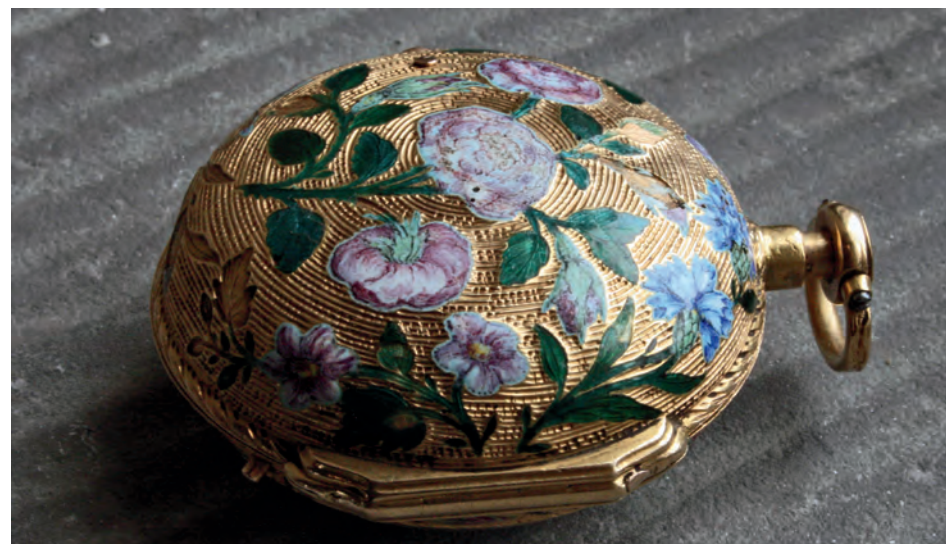
Baksidan av Pehr Scheffers fickur, som han fick i gåva av konung Ludvig XV av Frankrike år 1763.

tid i Frankrike avancerade han även i den svenska armén och blev vid sin hemkomst överste och chef för Savolax regemente, för att sluta som chef för Skaraborgs regemente 1772 och fältmarskalk 1778. Pehr Scheffers bröder Carl Fredric och Ulric upphöjdes båda i grevlig värdighet men tog aldrig introduktion som sådana eftersom de var barnlösa.