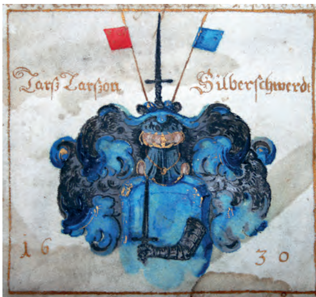
Silfverswärdska vapnet i originalsköldebrevet.

Enligt detta brev upphöjdes nämligen samtliga barn i framlidne fältmarskalken Herman