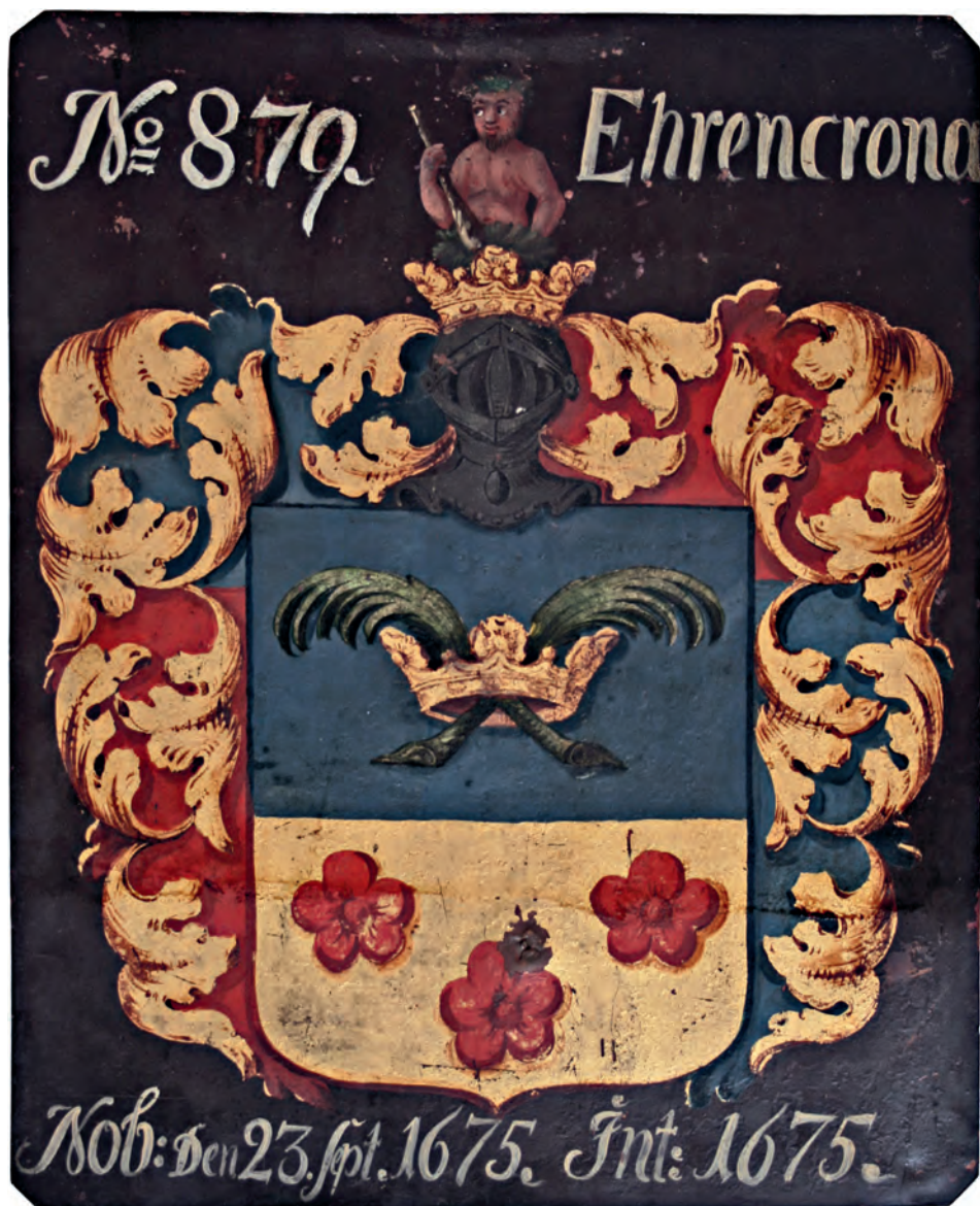
Adliga ätten Ehrencronas vapensköld, Rid-darhussalens vapenplåt.

hjälmprydningen och i det tredje fältet hos friherre Ehrenkrona. De tre blå femuddiga stjärnorna i ginstammen av silver återfinns med omkastade tinkturer ställda två och en i det friherrliga vapnets första fält. Även de två bjällkarna i silver har fått sin plats i det friherrliga vapnets fjärde sektion men då i ett rött fält istället för ett blått. Märkvärdigt nog har hjärtvapnet i det friherrliga vapnet återgivits helt korrekt utan de felaktigheter som drabbat det adliga vapnet.