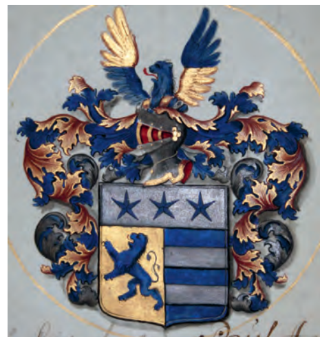
Adliga ätten Ehrenbielkes vapensköld, ur sköldebrevet.

Ytterligare en ledtråd uppstår när jag finner att friherrebrevet även saknar vapenritning. Mitt i blasoneringstexten finns det endast en lucka där vapenskölden borde finnas avbildad. Att ett sköldebrev ser ut på det här