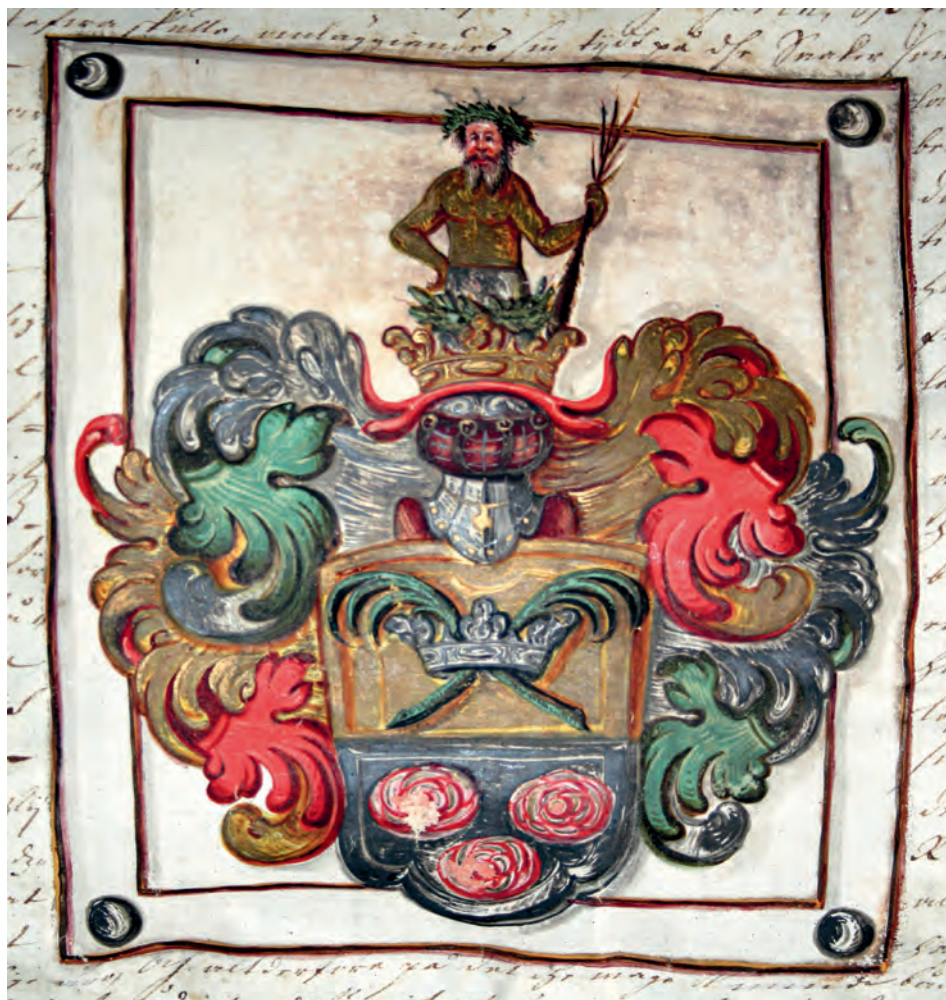
Adliga ätten Ehrencronas vapensköld, ur sköldebrevet.

När jag börjar med det äldsta sköldebrevet, det Ehrencronaska från 1675, fångar den utsökta målningen av vapenskölden direkt mitt intresse. Illustrationen följer blasoneringen till fullo. Det oroväckande är att avbildningen på pergamentet skiljer sig radikalt från vapenplåten som är uppsatt i Riddarhussalen. Där är vapnet delat i blått och guld med en krona av guld med två korsvis genomträdta palmkvistar i det övre fältet. I sköldebrevet är vapnet istället delat i guld och silver med en krona av silver. I det här fallet är givetvis sköldebrevet korrekt och vapenplåten fel. Även i Elgenstiernas verk Svenska Adelns Ättartavlor och i flera andra vapenböcker återges den felaktiga vapenskölden i blått och guld. Vapenskölden i sköldebrevet bryter egentligen mot ett par heraldiska grundregler – ett fält i metall (guld) gränsar direkt mot ett annat fält i metall (silver) och en krona i metall (silver) återfinns i ett fält av metall (guld). Ett hugskott är att framkasta teorin att målaren av vapenplåten, möjligen den produktive Elias Brenner själv,