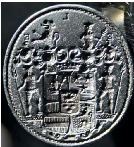
Sigillstamp med friherrliga ätten Ehrenkronas vapensköld.