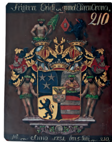
Friherrliga ätten Ehrenkronas vapensköld, Rid-darhussalens vapenplåt.

sättet är inte helt ovanligt. Rid-darhuset har flera exempel på detta i sina samlingar. Anledningarna kan vara flera men den enklaste förklaringen är förmodligen att det inte var obligatoriskt att avbilda vapenskölden i sköldebrevet. En paradox kan tyckas – men en vapensköld definieras inte av vapenritningen i sköldebrevet eller vapenplåten i Rid-darhussalen. Blasoneringen i sköldebrevet är det som bestämmer vapensköldens färger och innehåll. Skulle blasoneringen de facto stå i strid med vapenritningen, gäller blasoneringen.