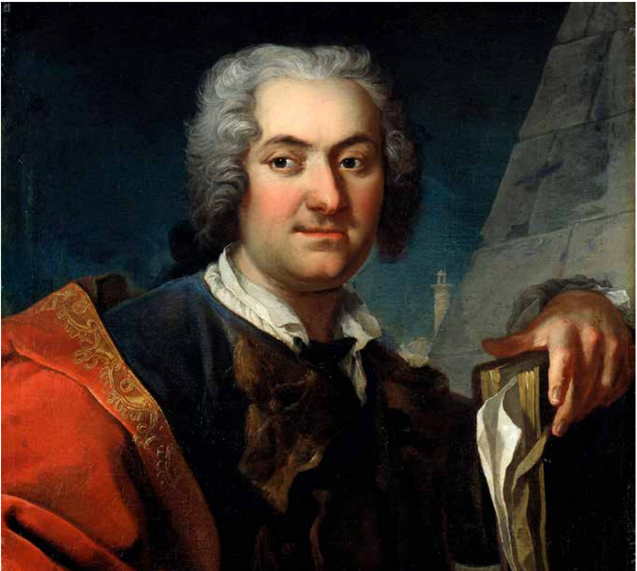
Martin van Meytens porträtt av Carl Hårleman från 1730 visar arkitekten mot bakgrund av berömda antika romerska byggnader.

utomhusarkitektur då de i antikens efterföljd ofta försågs med skenperspektiviska väggdekorationer eller marmorerings som imiterade och inspirerades av marmor och annan sten. Spår av den ursprungliga marmorade gipsputsen har återfunnits på en pilaster i övre trapphallen.